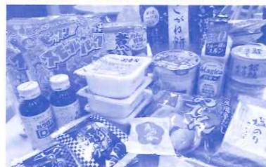
冬にぴったりな体の温まるものをいただきました。

フードバンクは、多くの皆様のご協力により成り立っています。あたたかいご支援をありがとうございます。