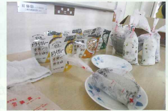
非常食・炊き出し食の展示