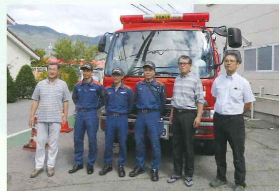
四ツ屋区役員さんと消防署員さんと記念撮影

また、日本赤十字社Webサイトの「災害時レシピ」を参考に、赤十字奉仕団員さんが炊き出しを行いました。(表紙参照)