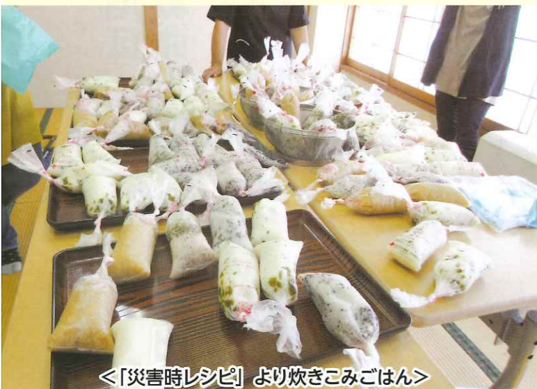
<「災害時レシピ」より炊きこみごはん>