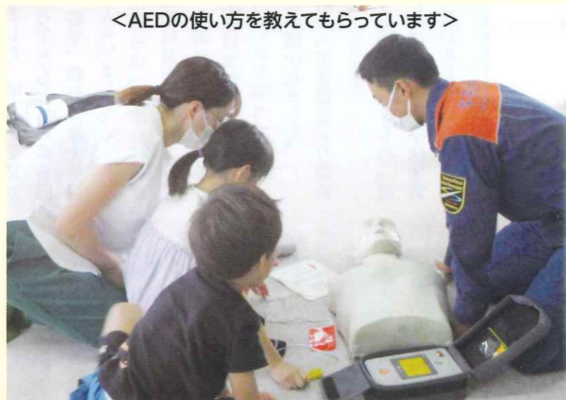
<AEDの使い方を教えてもらっています>

坂城・四ツ屋地区で防災訓練が実施されました。 (詳しくは2ページをご覧ください。)