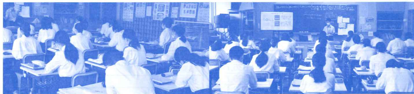
2学年「坂城学Ⅱ職業学習(福祉分野)」