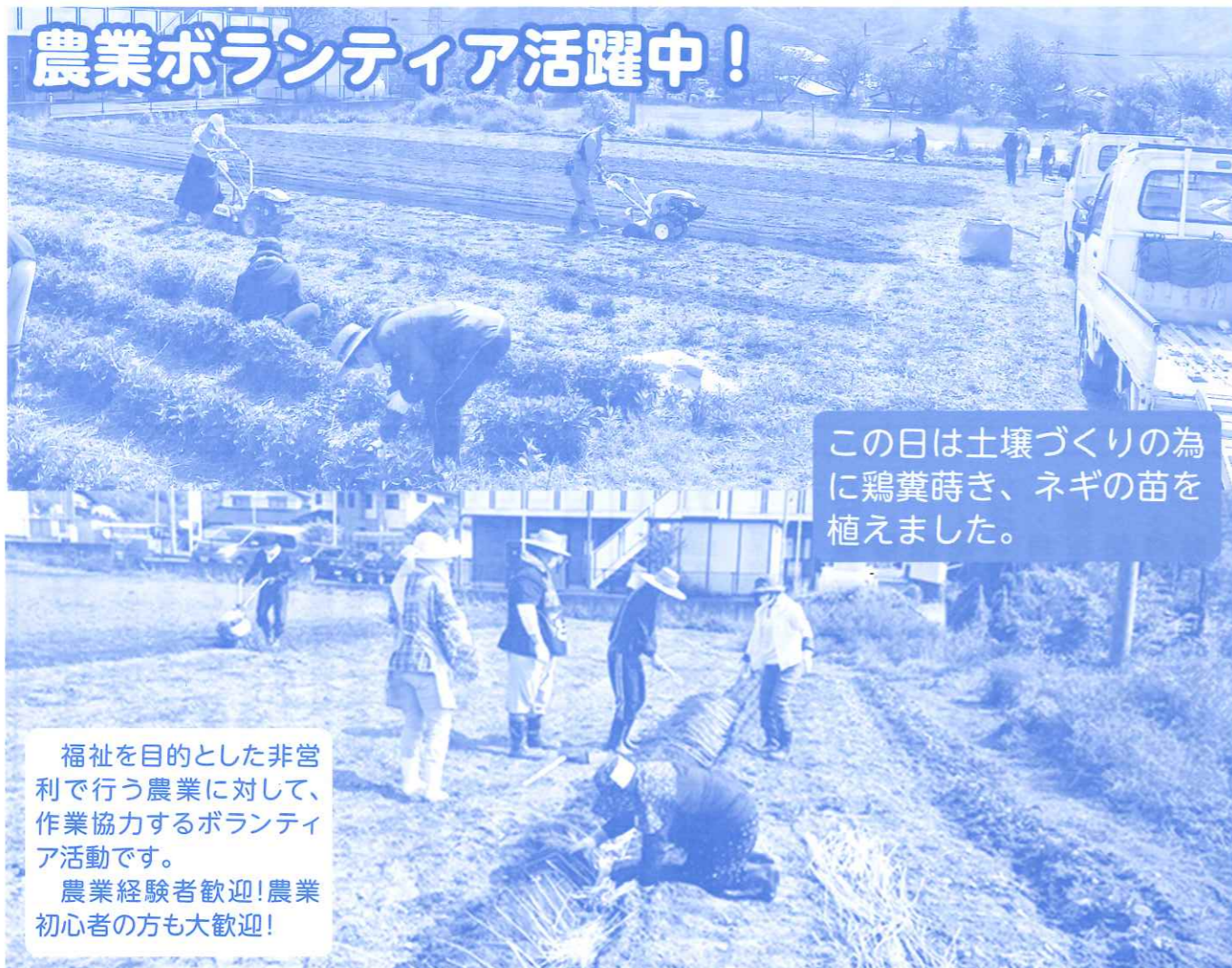
この日は土壌づくりの為に鶏糞蒔き、ネギの苗を植えました。

福祉を目的とした非営利で行う農業に対して、作業協力するボランティア活動です。 農業経験者歓迎!農業初心者の方も大歓迎!