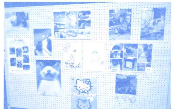
地域ねこを取り巻く状況について、意見交換会を併せて開催しました。