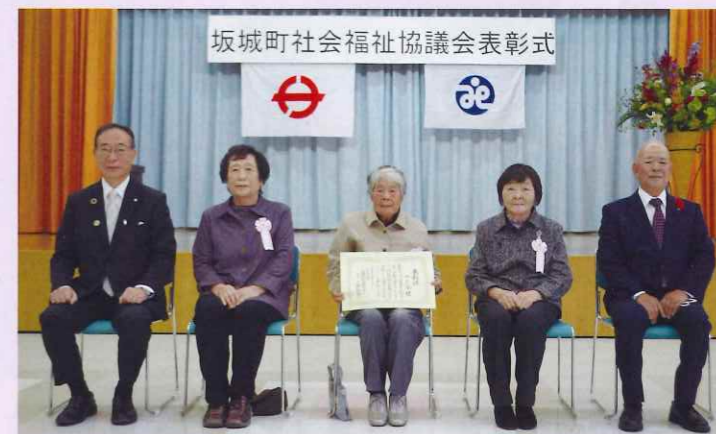
【社会福祉功労者】やよい会(地域支援グループ)