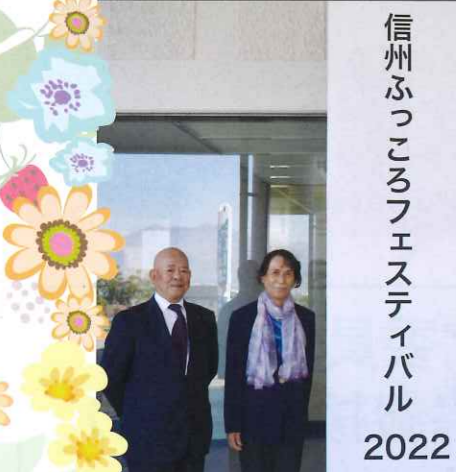
信州ふっころフェスティバル 2022