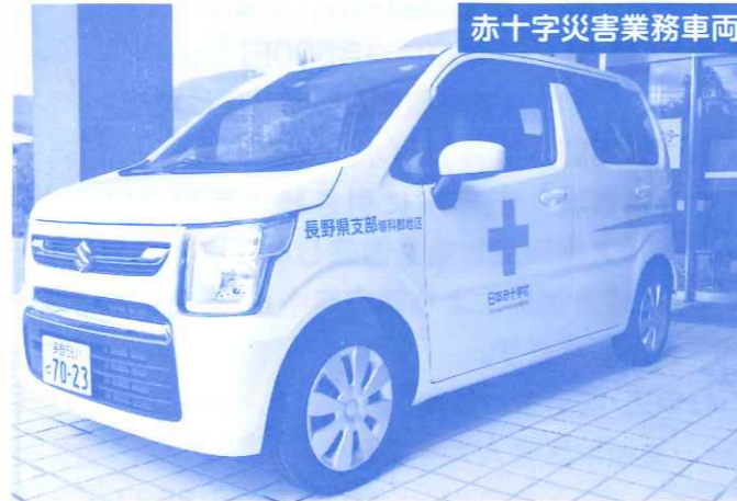
赤十字災害業務車両 日本赤十字社補助事業により配備