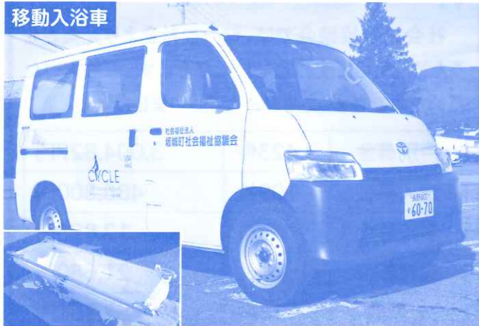
移動入浴車 JKA(競輪・オートレース)補助事業、坂城町より補助を受け配備