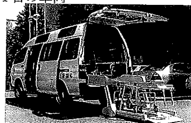
ストレッチャーリフト車両