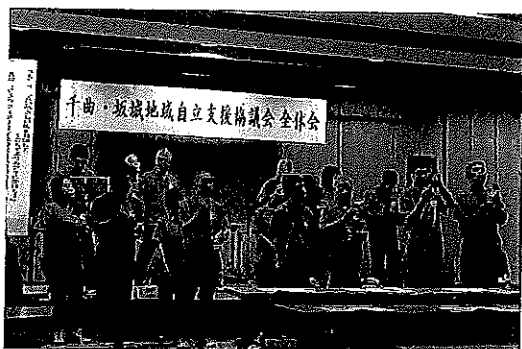
H29 年度 9 月 2 日 全体会「とくべえ〜ず」コンサート

千曲・坂城圏域に住む当事者や団体、サービス事業所などが、障がいのある方にとっての住みよい街づくりを一緒に考え、課題解決のため協働で取り組む組織です。本会も各部会等に参加し、障がい福祉の推進に努めています。