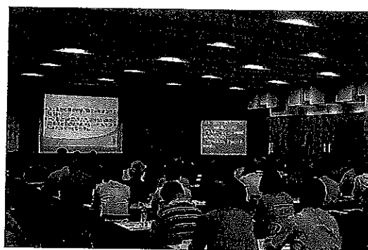
H29 年度全体会基調講演の様子