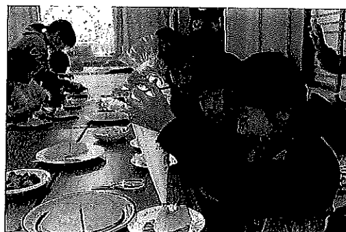
自分だけのデコレーションケーキを作ろう！