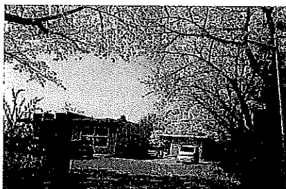
ぼだい桜の杜 外観

認知症対応型通所介護サービスを柱として、高齢者、障がい者、子ども、ボランティア等、様々な方が利用できる福祉の拠点として利用されています。地元の方をはじめ、各種団体の会議の場としてもご利用いただけます。