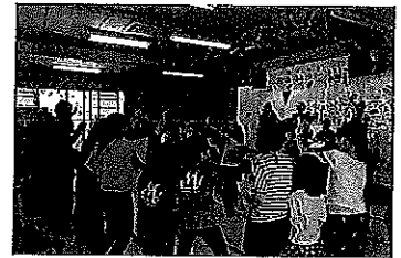
第 30 回記念コンサート