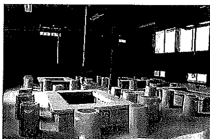
ぼだい桜の杜 創作体験室