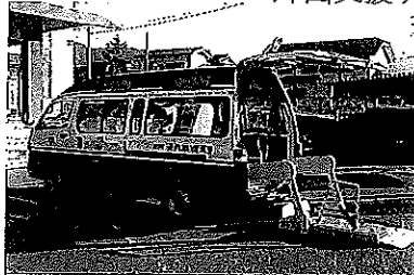
リフトバス(車イス 2 台を収容可能です)