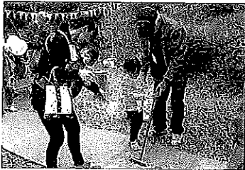
キッズコーナーの様子

内容：キッズ広場、販売コーナー、第 30 回記念コンサート、チャリティバザー 他