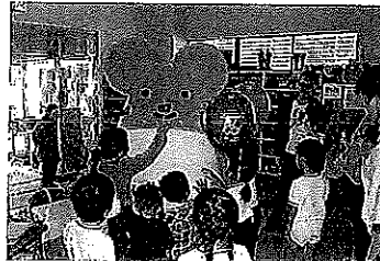
子どもに囲まれるねずこん