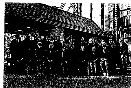
温泉交流会にて記念撮影