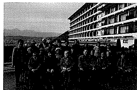
温泉交流会にて記念撮影