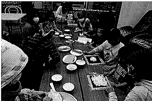
太巻きを自分で作ってみよう！