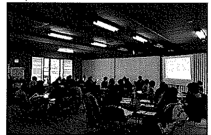
検討委員会の様子

より町民の皆さんが参加できるよう、福祉ふれあいのつどいから『地域交流事業 (仮)』として開催するにあたりどのような形で行えばよいかなど、ふれあいのつどい実行委員会のメンバーを招集して検討委員会を開催。