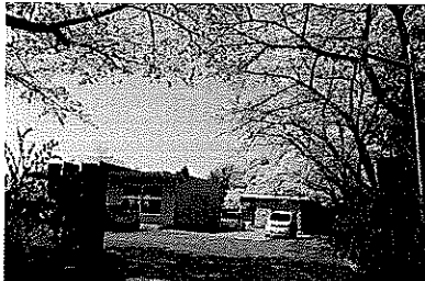
ぼだい桜の杜 外観

認知症対応型通所介護サービスを柱として、高齢者、障がい者、子ども、ボランティア等、様々な方が利用できる福祉の拠点として利用されています。地元の方をはじめ、各種団体の会議の場としてもご利用いただけます。