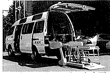
ストレッチャーリフト車両