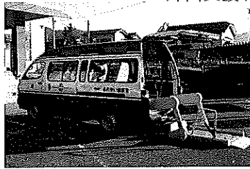
リフトバス(車イス2台を収容可能です)