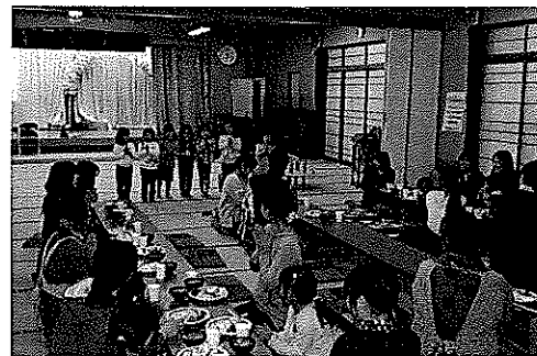
みんなで「いただきま〜す！」