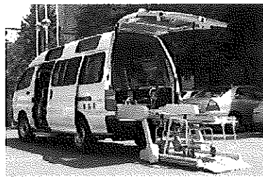
ストレッチャーリフト車両