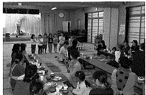
みんなで「いただきます〜す！」