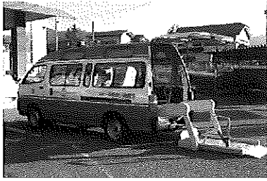
リフトバス(車イス2台を収容可能です)