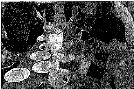
自分でケーキをトッピングしよう！