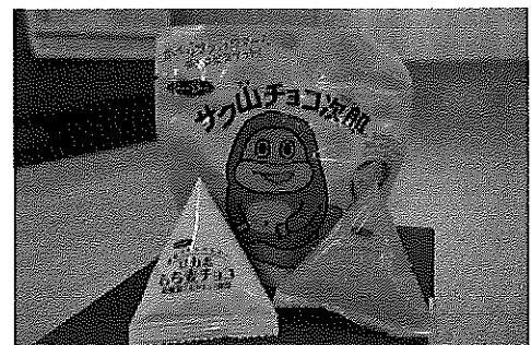
チョコレートの寄贈