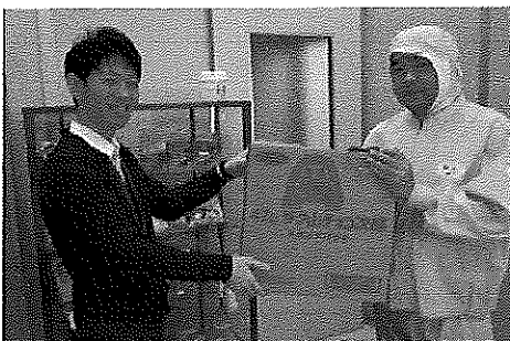
(株) ロビニア様が協賛