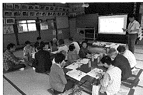
安心の地域づくり学習会の様子