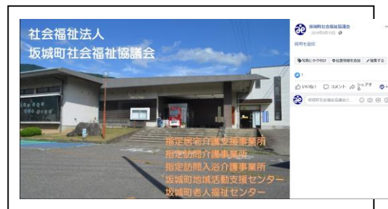
Facebook ページ top