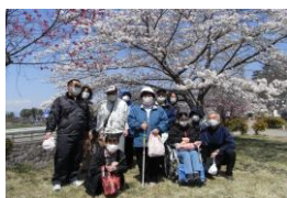
【びんぐし公園 桜の花見】