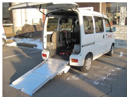
車いすに乗ったまま乗降できます