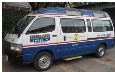
車いすに乗ったまま乗車できます