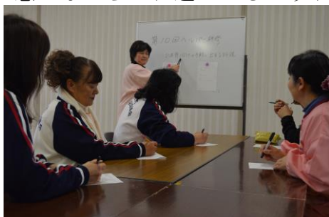
訪問介護員の研修の様子

宅老所ぼだい桜の杜のデイサービスでは、家庭の中にいるような温もりを感じながら一日過ごせるようサービスを実施します。