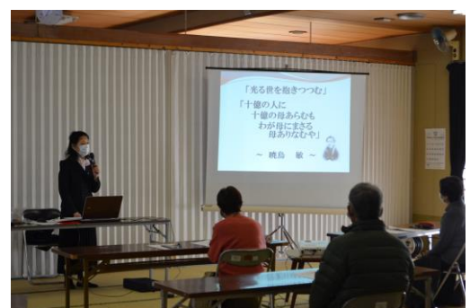
傾聴ボランティア講座の様子

※ボランティア活動保険（災害ボランティア保険）、ボランティア行事用保険の窓口事務を含む