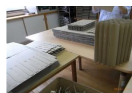
【段ボール 組み仕切り作 業】