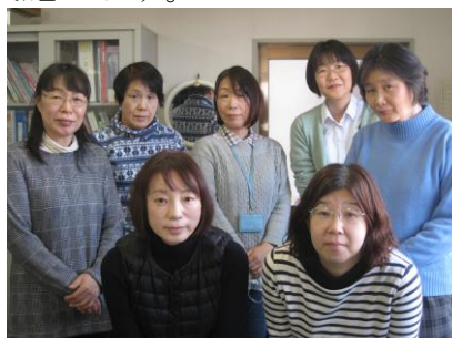
ケアマネジャースタッフ