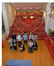
【三十段の雛飾り ・須坂市】