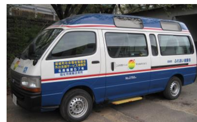
車いすに乗ったまま乗車できます