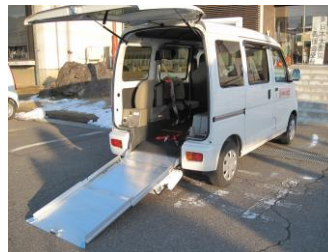
車いすに乗ったまま乗降できます