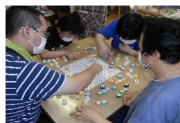
【レクリエーション ・数合わせゲーム】