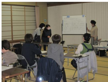
訪問介護員の研修の様子