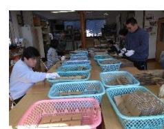
【段ボール組み仕切り】