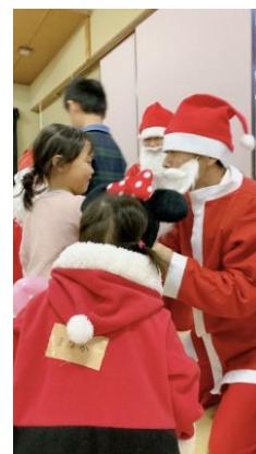
こどものひろま in クリスマス

※ボランティア活動保険（災害ボランティア保険）、ボランティア行事用保険の窓口事務を含む