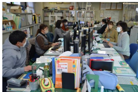
ケアマネジャースタッフ