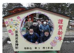
【恒例の初詣・ 生島足島神社】