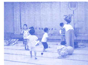
こどものひろまの様子