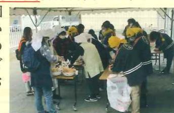
上五明区防災訓練の様子

5月1日～5月31日までの間は日本赤十字社活動資金募集月間です。 募集月間になりましたら、赤十字奉仕団員がお宅にお伺いします。赤十字の活動にご理解とご協力をよろしくお願ひします。