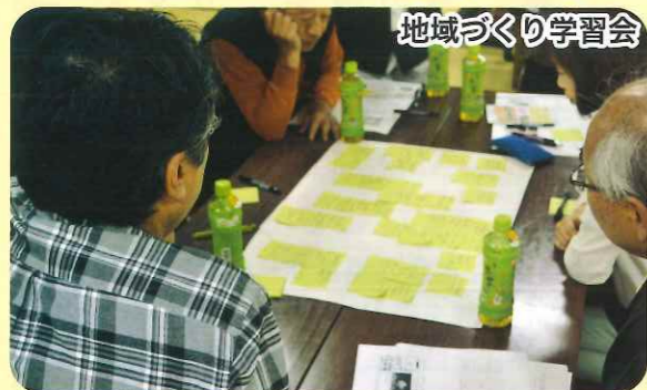
地域づくり学習会

令和2年度も地域の皆様と共に 「みんなが自分らしく安心して笑顔で暮らせる 地域づくり」を目指して参ります。