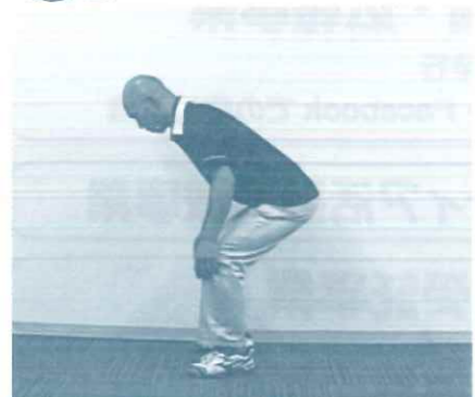
スクワット (筋トレ)