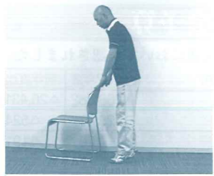
つま先立ち (筋トレ)